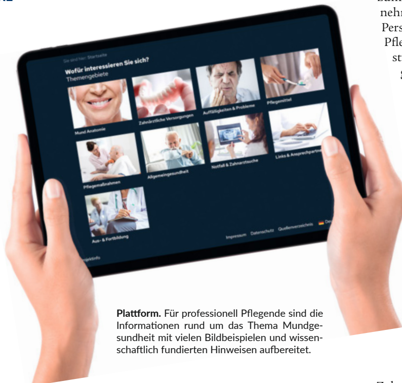
Plattform. Für professionell Pflegende sind die Informationen rund um das Thema Mundgesundheit mit vielen Bildbeispielen und wissenschaftlich fundierten Hinweisen aufbereitet.

bildung und Studium der Pflege finden? Und wie kann das Wissen mit einem niederschweligen Angebot möglichst anschaulich bundesweit verfügbar gemacht werden? Für die technische Realisierung konnte Dr. Ludwig das Steinbeis-Forschungszentrum Design und Systeme in Würzburg gewinnen. „Die Gruppe ist sehr ambitioniert, innovativ und hatte große Lust auf Mundgesundheit“, so Ludwig.